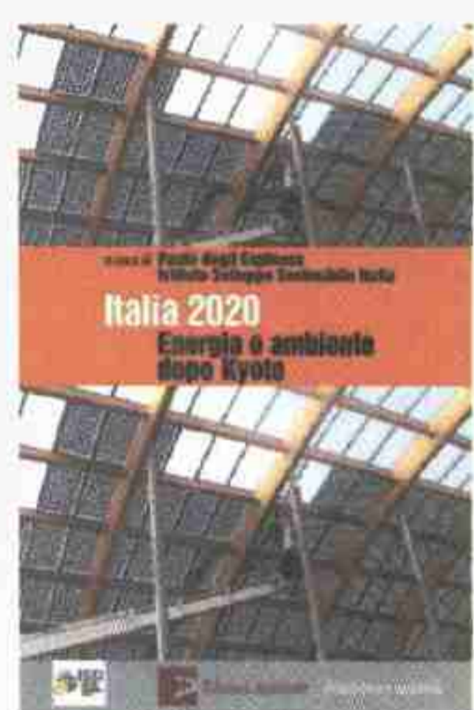
Paolo degli Espinosa (a cura di) ITALIA 2020. ENERGIA E AMBIENTE DOPO KYOTO Edizioni Ambiente pp. 281, euro 20

Uscito negli stessi giorni in cui veniva presentato il Living planet report , rapporto annuale del Wwf che ha spiegato ai media di tutto il mondo che nel 2050 la Terra potrebbe somigliare a un barattolo vuoto, questo libro curato da Paolo degli Espinosa, direttore del dipartimento Energia dell'Issi (Istituto sviluppo sostenibile Italia), si concentra sullo scenario più vicino del 2020 e sulla questione delle politiche energetiche nel nostro paese.