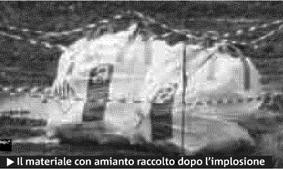
► Il materiale con amianto raccolto dopo l’implosione