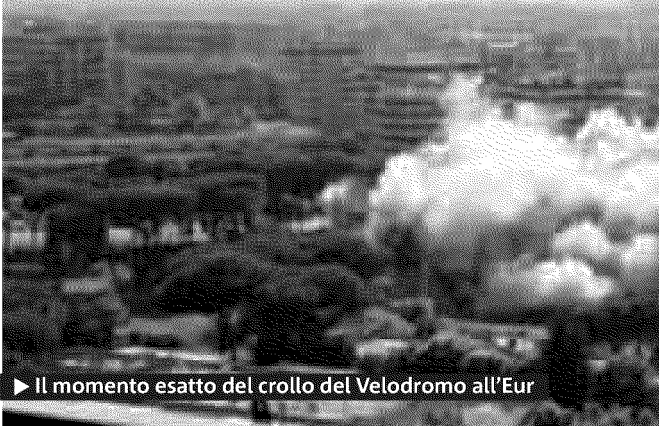
► Il momento esatto del crollo del Velodromo all'Eur