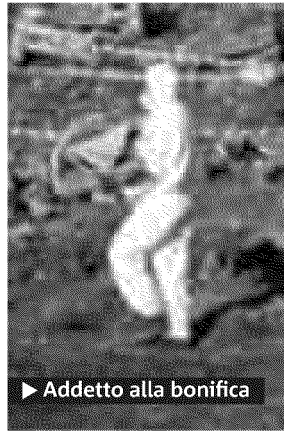
► Addetto alla bonifica