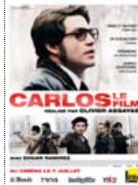
OLIVIER ASSAYAS Carlos

Ultimo lavoro del regista francese Olivier Assayas, Carlos è una lunga presa in diretta della vita di Ilich Ramírez Sánchez, nome di battaglia "Carlos", celebre rivoluzionario venezuelano, tra i massimi ricercati mondiali per terrorismo negli anni Settanta e Ottanta. Olivier Assayas sceglie per i 185 minuti di questa pellicola trilingue, che in origine era una serie tv, un linguaggio inusuale, unendo diversi formati (super 16, 35 mm). Figura complessa e ambigua, Carlos si formò nei campi giordani di addestramento dei guerriglieri palestinesi dell' Fplp , che ebbe contatti con tutte le realtà dell'eversione organizzata in Medio Oriente ed Europa. Il 21 dicembre del 1975