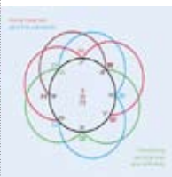
STEVE COLEMAN Harvesting semblances Pi recordings

Il jazz contemporaneo è diventato una sorta di "world music", forse l'unica vera "world music", che non ha niente a che fare con quella legata agli evanescenti ed effimeri movimenti "new age". Steve Coleman, talentuoso altosassofonista di Chicago, maturato artisticamente a New York nell'ambiente della musica creativa,