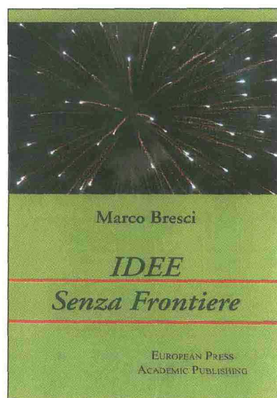
Idee Senza Frontiere Marco Bresci European Press Academic Publishing

Un libro sulle idee che esprime la volontà di slegarne la concezione dal singolo individuo, per permetterne l'utilizzo a chiunque, indistintamente. L'autore per primo offre in queste pagine spunti e soluzioni su diversi argomenti: affronta la mobilità come problema quotidiano, analizza la questione energetica, sempre più impellente, e i cambiamenti climatici connessi. Ma non solo: guarda alla salute, alla religione, all'economia, fino a toccare temi più generali sull'evoluzione della società odierna e sui vecchi e nuovi valori del terzo millennio. Il volume appare dunque come prima forma embrionale di una banca dati contenente idee e riflessioni accessibili a tutti, un nuovo modo per venire incontro ai problemi comuni, cercando di risolverli attraverso una collaborazione libera e universale, senza confini né frontiere.