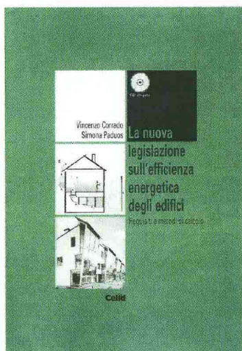
La nuova legislazione sull'efficienza energetica degli edifici Requisiti e metodi di calcolo Vincenzo Corrado, Simona Paduos Edizioni Celid

Il volume è un'utile guida e un pratico strumento di progetto per districarsi tra i requisiti, i valori imposti, i parametri prestazionali e gli ambiti di applicazione, nel campo dell'efficienza energetica in edilizia. Dall'emanazione dei decreti legislativi 192/05 e 311/06 il contenimento dei consumi è diventato un requisito fondamentale nella progettazione e il libro, oltre alle definizioni approfondite, propone una parte dedicata alla valutazione analitica dei parametri energetici, con calcoli presentati in forma di flow chart, utili per appropriarsi del corretto iter da seguire. Un'attenzione particolare è stata inoltre dedicata alla documentazione tecnica che un progettista è tenuto a compilare. Relazioni, attestati di qualificazione o di certificazione energetica, per ogni documento è proposta una chiave di lettura critica che tiene conto di tutto ciò che riguarda il risparmio energetico all'interno della recente Finanziaria 2008. In appendice un'analisi delle leggi regionali in materia e un cd allegato contenente i testi integrali dei due decreti 192/05 e 311/06 e delle ultime due finanziarie.