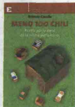
Meno 100 chili Roberto Cavallo Edizioni Ambiente pp. 222, 14 euro

IL SOTTOTITOLO RECITA: "RICETTE PER LA NOSTRA pattumiera". Nel libro, ispirato a un suo spettacolo teatrale, Roberto Cavallo oltre a fornirci dati sui rifiuti prodotti nelle nostre case ci accompagna nel mutamento radicale del nostro paese. Lo fa con leggerezza: "Mio nonno non avrebbe capito. Se avessi dovuto spiegargli che una legge dello Stato, a lui, al quale incuteva timore la parola Stato con la s maiusola, che una legge imponeva di ridurre i rifiuti, di riusare le cose e di recuperare i materiali sono certo che non mi avrebbe capito e, probabilmente, nemmeno creduto. Quando il buon senso non basta più e ci vuole una legge, allora c'è qualcosa che non va.. Eppure è così: addirittura una direttiva europea ha dovuto sottotitolarsi 'verso una società del riciclo'".