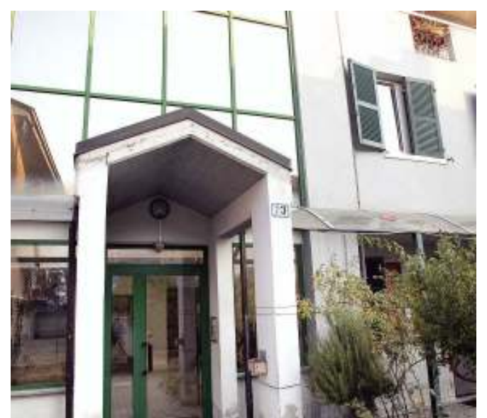
Il palazzo dell'Atc in via De Gasperi ad Alba