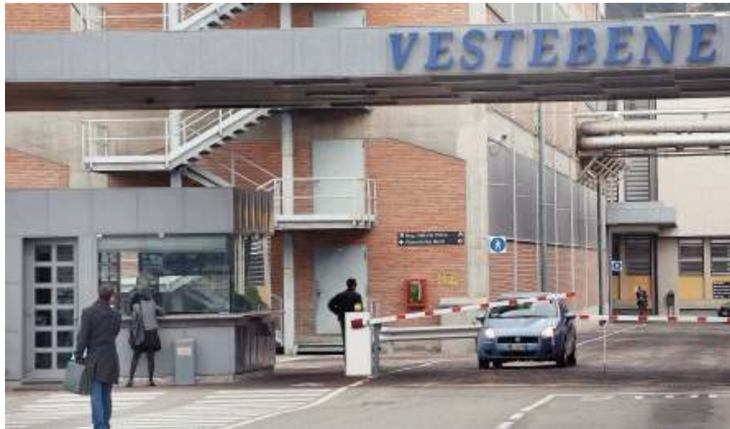
I giovani designer utilizzeranno tessuti prodotti da Miroglio Textile

La tre giorni si aprirà oggi, dalle 10 alle 12, con un convegno che permetterà ai fashion designer di inquadrare lo scenario a partire dal quale si troveranno a operare, scoprire l'arte di Pinot Gallizio, capirne