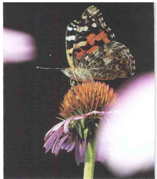
Una farfalla. Nella foto grande: un anemone di mare. Sotto: l'economista Giorgio Ruffolo