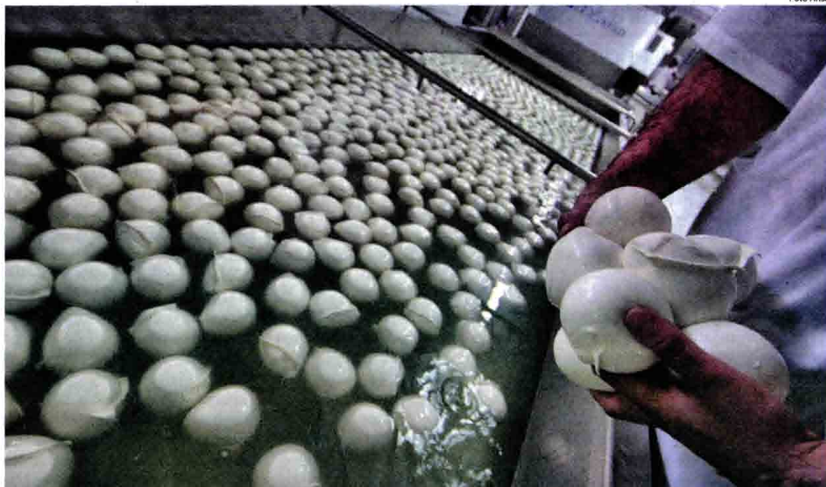
Mozzarelle in un'industria casearia Non ci sono solo i formaggi negli affari della criminalità organizzata