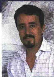
VINCENT CALLEBAUT, 33 ANNI, ARCHITETTO BELGA