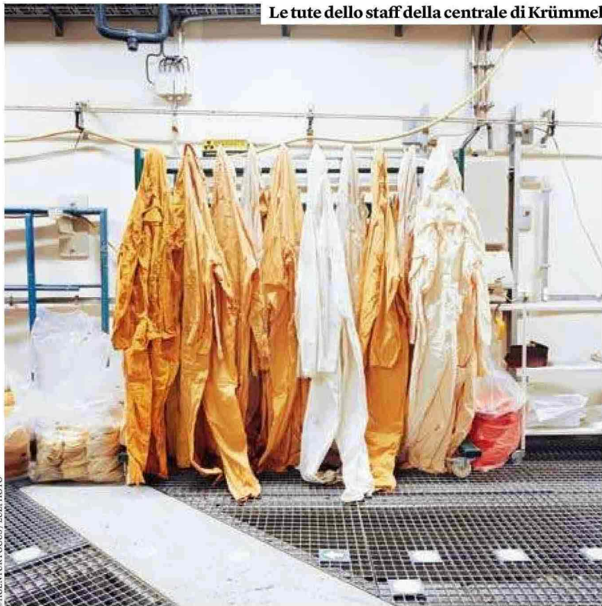
Le tute dello staff della centrale di Krümmel