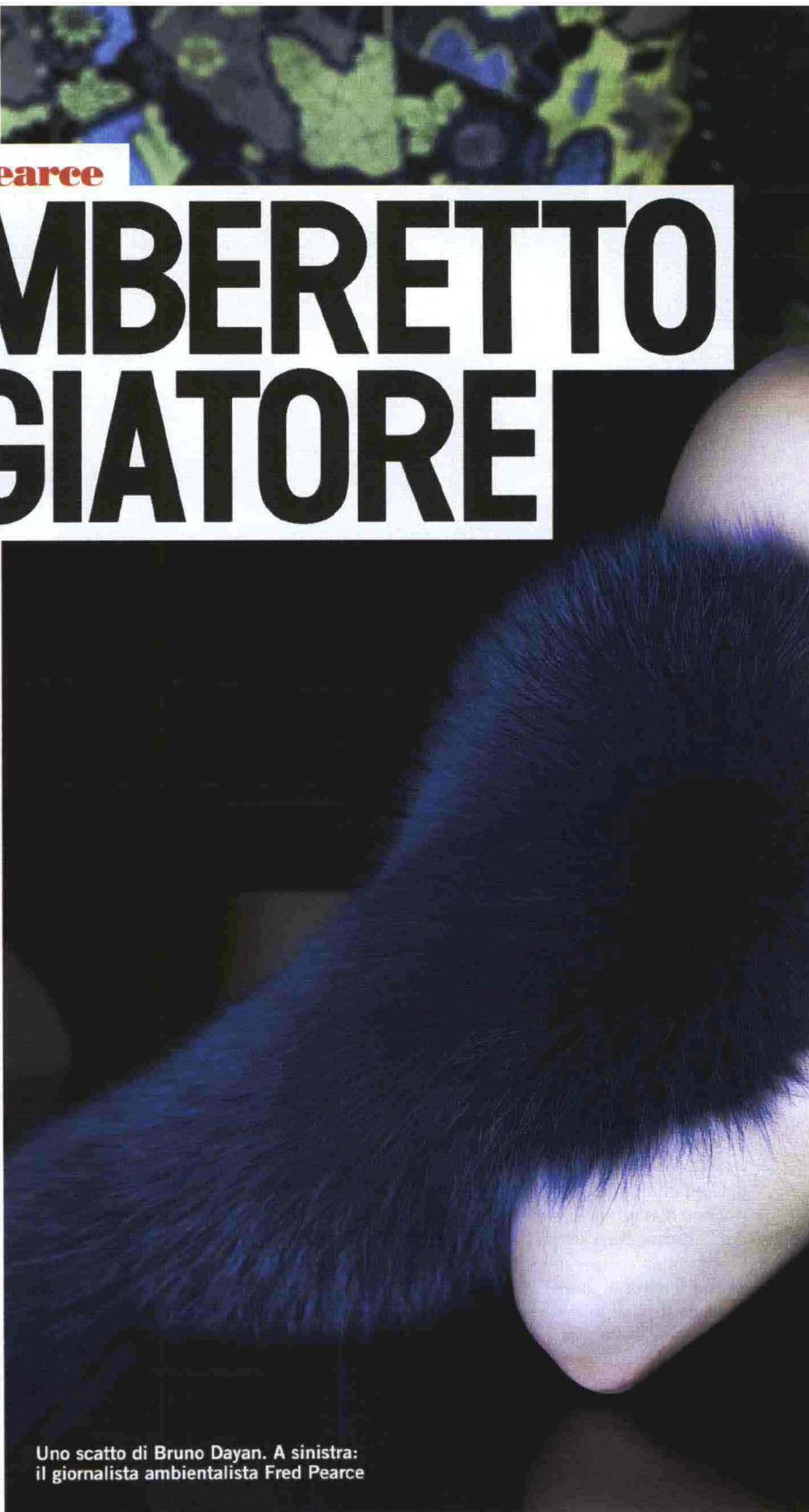
A sinistra: il giornalista ambientalista Fred Pearce