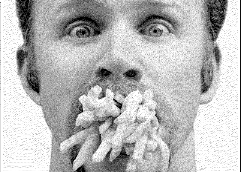
Celebre immagine di Morgan Spurlock nel docufilm Super Size Me