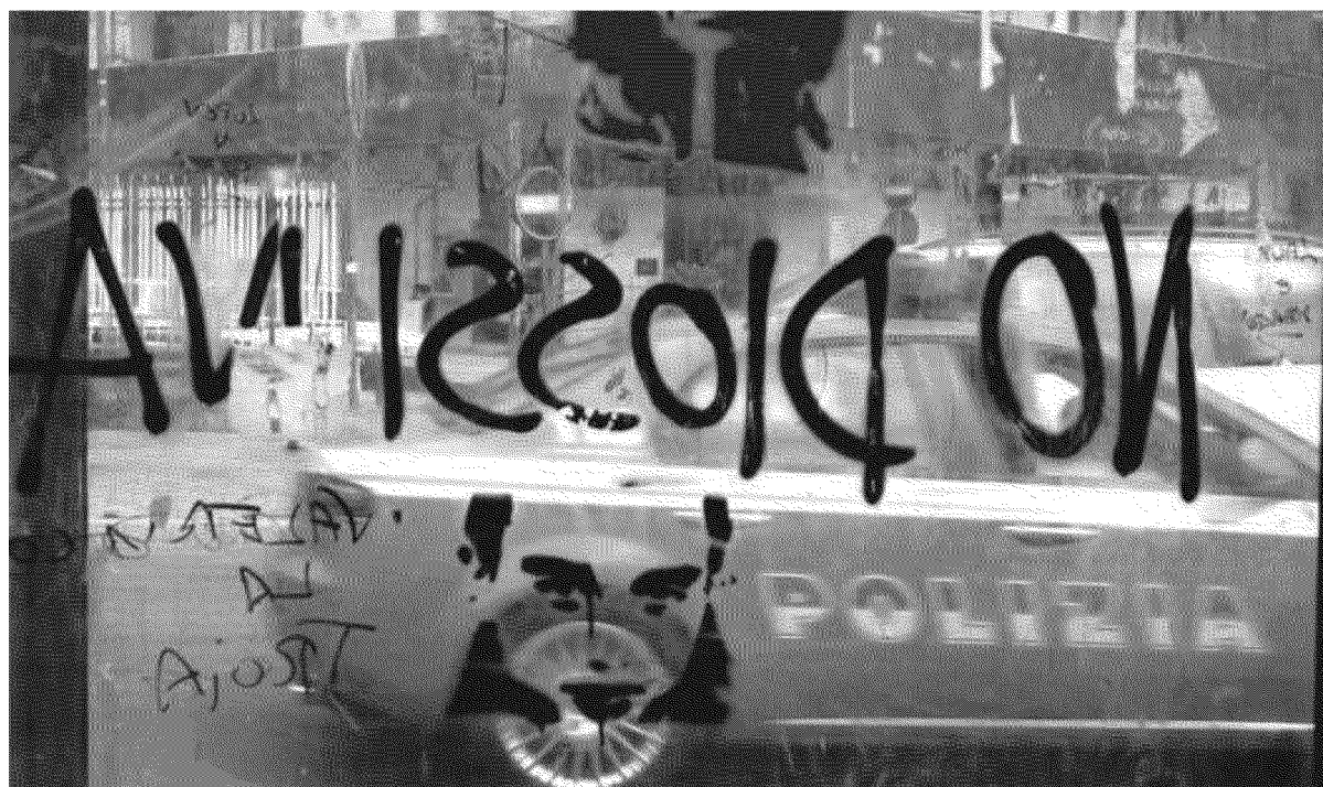
La protesta contro la diossina in una foto tratta dal sito di Roberto Saviano

L'ultima cena A tavola con i boss Pepe Ruggiero pagine: 184 euro 14,00 Edizioni Ambiente