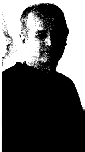
Fotografo. Giovanni Giovannetti, lavora nella rivista "Primo Amore"

LA TENDENZA «Il fenomeno della mafia che investe in Borsa è degli ultimi 30 o 40 anni»