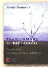
Alessio Battistella Trasformare il paesaggio Edizioni Ambiente 282 pagine 24,00 euro

Le centrali eoliche sono in questi tempi oggetto e origine di molte polemiche. Quelle pale mosse dal vento sono uno sfregio al paesaggio, è il capo d'accusa. Un'accorata memoria difensiva viene dal libro di Alessio Battistella , architetto impegnato sui temi dell'integrazione paesaggistica di grandi infrastrutture. Questi impianti di energia rinnovabile non solo sono in grado di integrarsi con il territorio, ma lo rivalutano e sono espressione dei luoghi che li ospitano. Sono simboli che uniscono alla produzione la rappresentatività. Non ha quindi senso demonizzarli. Si tratta piuttosto di integrarli nel territorio, individuando regole di progettazione. Battistella cita il caso virtuoso della carta del dipartimento di Finistère, in Bretagna. Quelle pale sono dunque figlie del nostro tempo. Non a caso nel film Volver di Pedro Almodóvar caratterizzano le piane della Mancha, un tempo consacrate ai mulini da Cervantes.