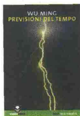
Wu Ming Previsioni del tempo Edizioni Ambiente pp. 185, euro 10

T itolo e fulmine di copertina possono far pensare che il settimo libro uscito per la collana "Verdenero" (noir di ecomafia) sia dedicato ai cambiamenti climatici. Invece si parla di rifiuti. La Campania è solo il punto di partenza del racconto, che viaggia in un camion pieno di maiali macellati da Caserta a Napoli e poi verso nord sull'autostrada del Sole, incagliandosi in una serie di intrighi, droghe, armi, mafia nostrana e internazionale.